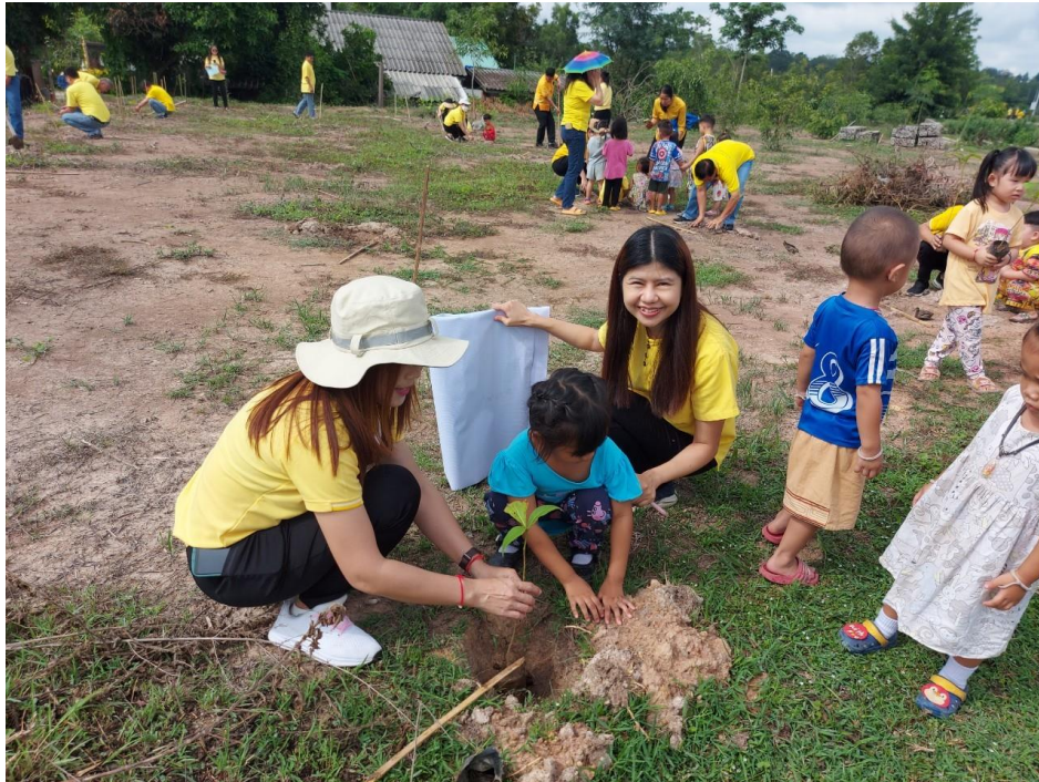
๓.๒ กิจกรรมร่วมฟื้นฟูปุทธิพยากรณ์ปลา และสัตว์น้ำจืดของไทย ณ อ่างเก็บน้ำร่องตั่ว หลังที่ทำการองค์การบริหารส่วนตำบลดงเจน