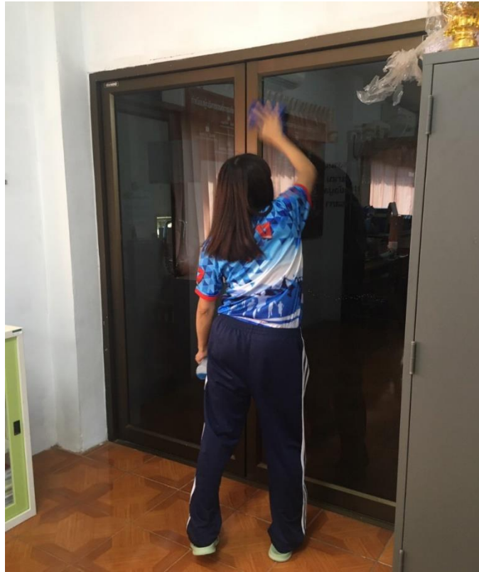
ภาพกิจกรรม Clean & Green