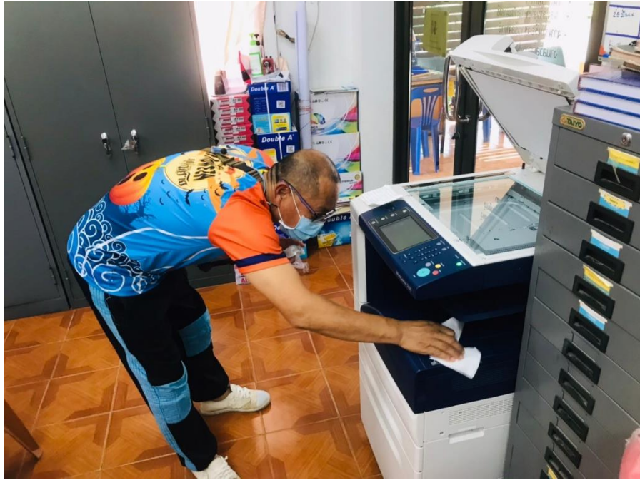
ภาพกิจกรรม Clean & Green