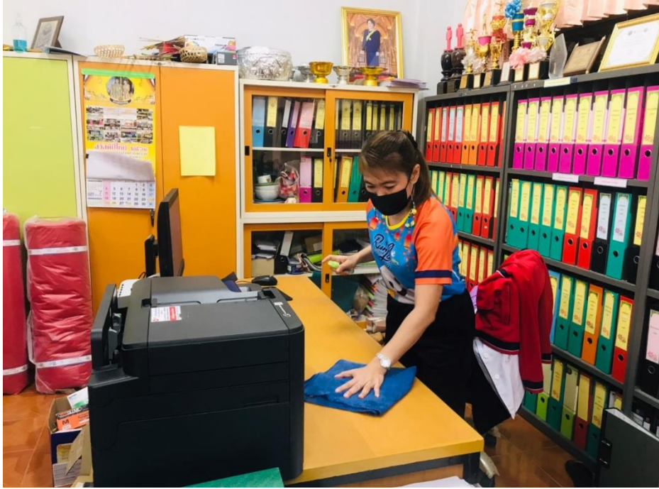
ภาพกิจกรรม Clean & Green