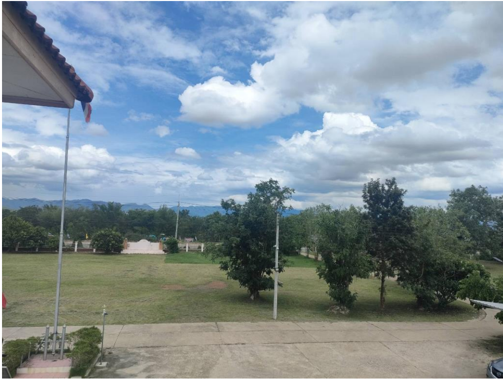
ภาพกิจกรรม Clean & Green