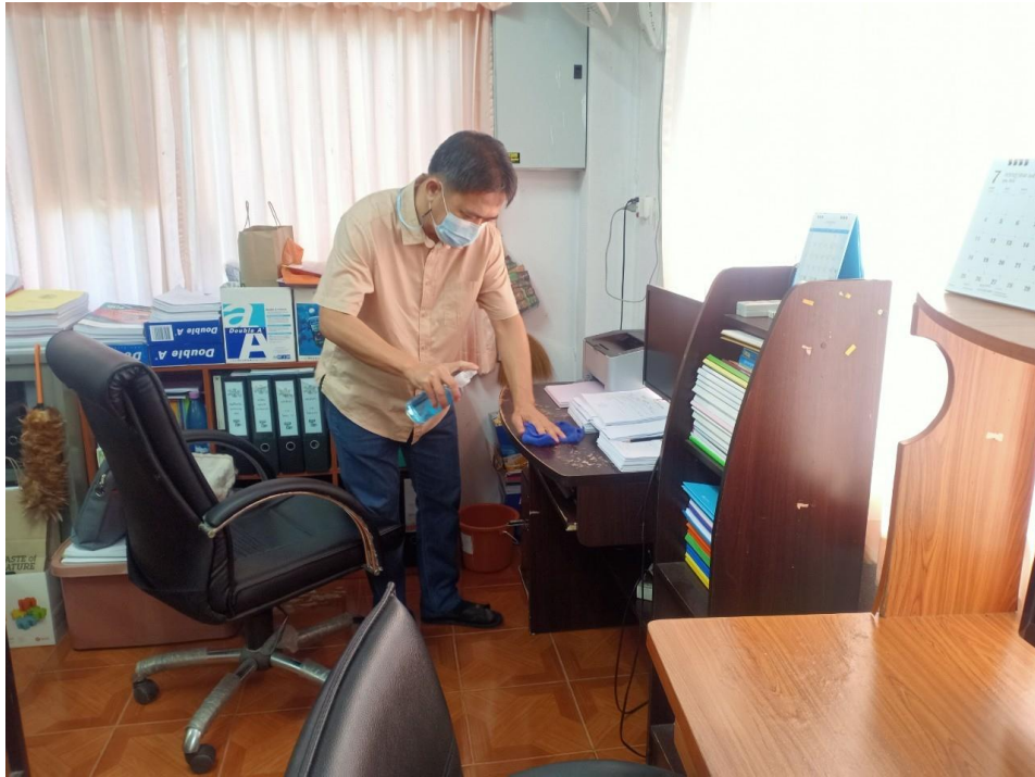
ภาพกิจกรรม Clean & Green