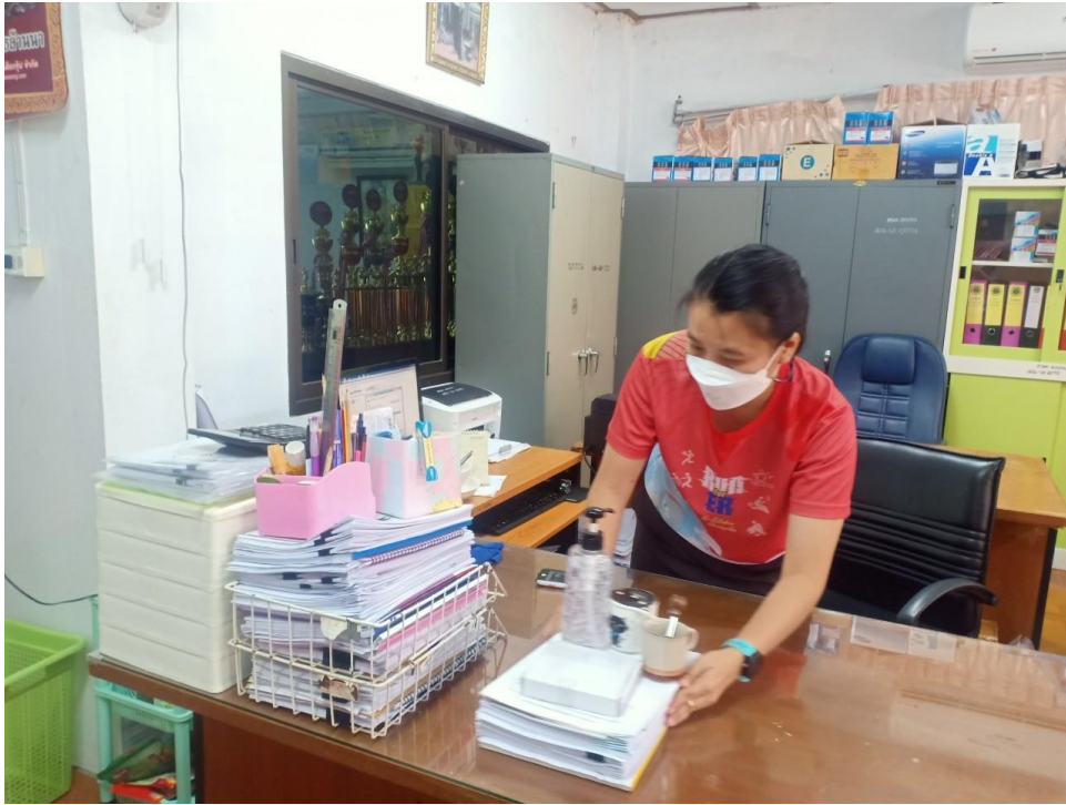
ภาพกิจกรรม Clean & Green